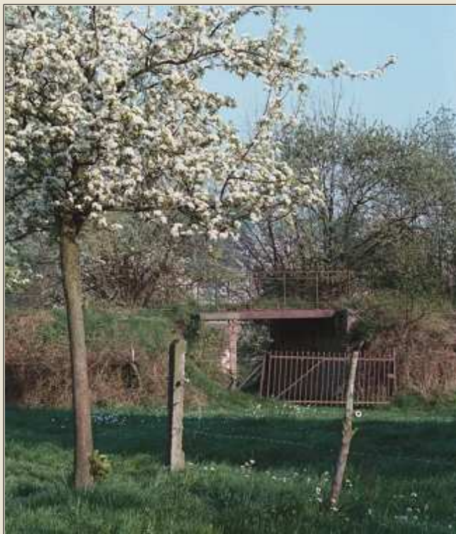
Le pont de la rue Parfondvaux. Ci-dessus, trois photos du même pont dans les années 1970 et à droite juste avant sa démolition.

Après le virage de la rue de la Balle, les voies du tram construites sur un talus, longeaient la rue Parfondvaux. Sur cette photo de la procession annuelle, on aperçoit à l'arrière les caténaires.