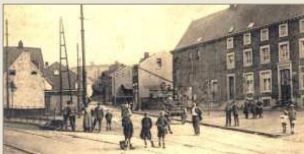
Jupille - Chapelle St Roch - près de l'arrêt Lochet

L e terminus du tram se trouvait quai des Pêcheurs à Liège. De là, il traversait Bressoux, Jupille avant d'arriver à Bellaire, le village voisin de Saive. Il serpentait ensuite par "les Sauvages Mêlées" pour gagner le bas du Champ du Pihot où se trouvait l'arrêt "Queue-du-Bois".