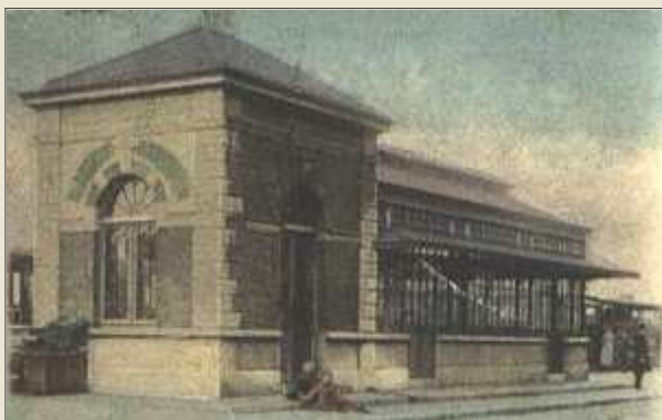
Le premier terminus du tram, quai des Pêcheurs à Liège

C' est en 1895 que la société des chemins de fer Vicinaux (S.N.C.V.) créée peu de temps auparavant entreprend la construction d'une ligne vicinale entre Liège et Barchon. Mise en service en 1898, elle sera ensuite prolongée jusqu'à Fourn-le-Comte via Dalhem. Cette liaison ferrée permettra pendant de longues années d'acheminer à Liège les produits des nombreuses fermes mais aussi des armuriers locaux. Longtemps après le remplacement de ce petit train par des autobus (1955), le village gardera des traces de son passage.