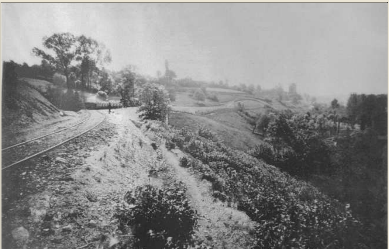
La montée vers Barchon à flan de colline (Vieille Foulerie) Au loin à droite, le donjon du vieux château.

La montée traversant le bois de la Vieille Foulerie sera réutilisée comme assise pour le vicinal.