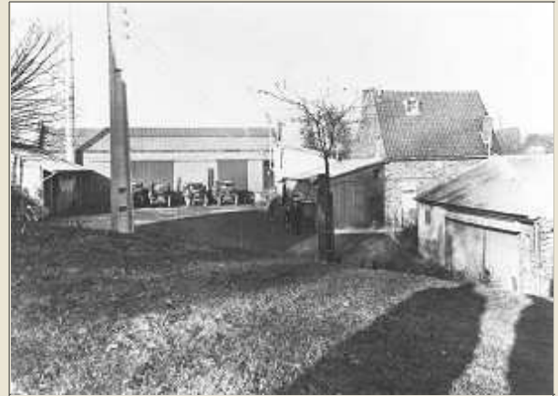
La laiterie Delrez dans les années 1930

Situé juste à côté de l'ancienne laiterie Delrez, le pont au-dessus de la rue du Frise existe toujours même si ça fait belle lurette que plus rien ne passe dessus. La laiterie, elle, a disparu et ses anciens bâtiments ont connu depuis lors, bien des transformations.