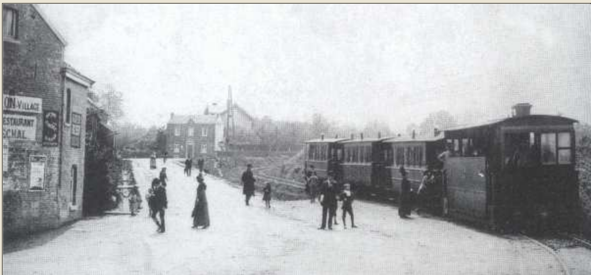
L'arrêt de Barchon (Café Maréchal - ferme Delnooz)

T raversant le bois de la Vieille Foulerie, le vicinal gravissait les pentes menant jusque Sur les Heids et au village de Barchon. Ensuite il continuait sa route par Blegny, Dalhem pour s'arrêter enfin à Fouron-le-Comte.