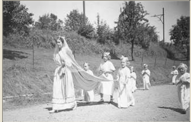
La rue Parfondvaux (v. 1950)

À gauche de la rue de la Balle, ce chemin a remplacé l'ancienne voie du tram. C'est ici qu'il virait à 90° pour rejoindre le centre du village. Suite au lotissement de la rue Parfondvaux, il ne mène plus nulle part.