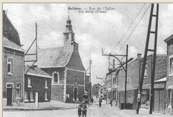
La traversée du centre de Bellaire (v. 1941)

La ligne sera progressivement électrifiée dans les années 40 (Bellaire-Saive en 1941).