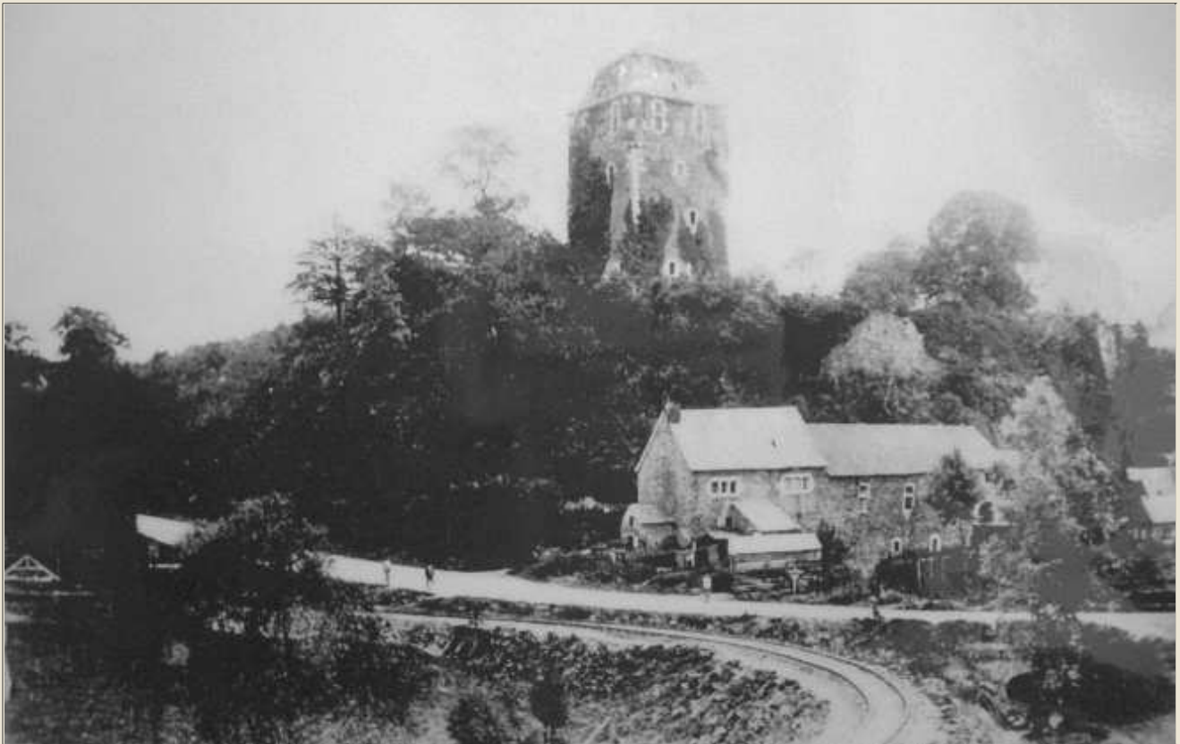
Le franchissement de la Julienne par la voie militaire au Grand-Moulin. (avant 1895)

L e tracé du vicinal reprendra en partie celui d' une voie militaire. Il s' agissait d' un train léger qui venant de la Xhavée, traversait la campagne de Rabosée en suivant les courbes de niveau pour arriver ici au pied du vieux château.