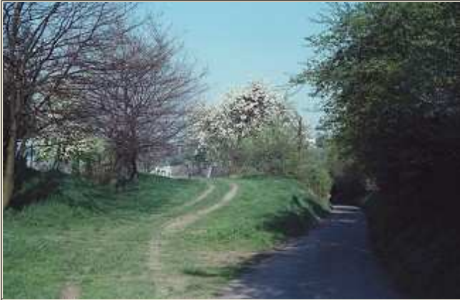
La rue de la Balle (v. 1980)

À gauche de la rue de la Balle, ce chemin a remplacé l'ancienne voie du tram. C'est ici qu'il virait à 90° pour rejoindre le centre du village. Suite au lotissement de la rue Parfondvaux, il ne mène plus nulle part.