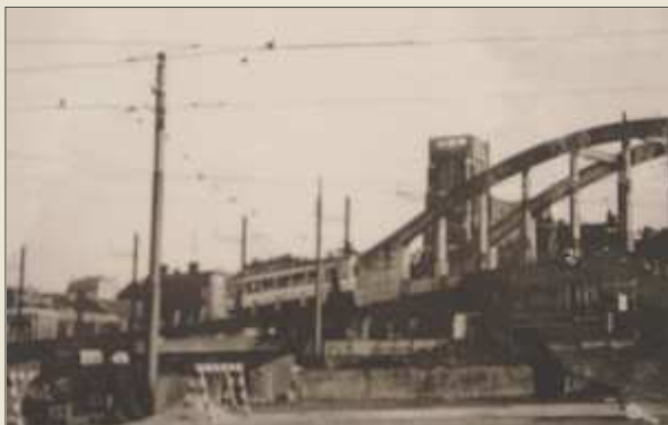
Le tram franchissant le chemin de fer à la gare de Bressoux

C' est en 1895 que la société des chemins de fer Vicinaux (S.N.C.V.) créée peu de temps auparavant entreprend la construction d'une ligne vicinale entre Liège et Barchon. Mise en service en 1898, elle sera ensuite prolongée jusqu'à Fourn-le-Comte via Dalhem. Cette liaison ferrée permettra pendant de longues années d'acheminer à Liège les produits des nombreuses fermes mais aussi des armuriers locaux. Longtemps après le remplacement de ce petit train par des autobus (1955), le village gardera des traces de son passage.