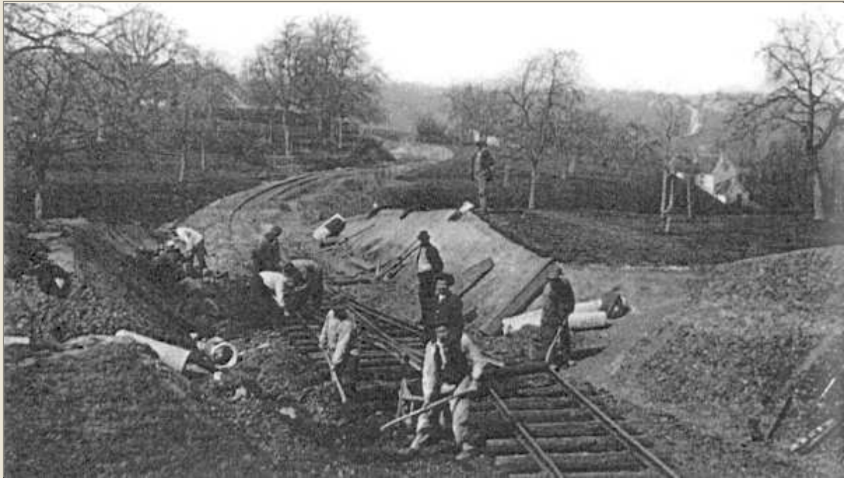
Remplacement de la voie militaire par les rails plus écartés du vicinal sur les hauteurs du village (sur les Heids).

T raversant le bois de la Vieille Foulerie, le vicinal gravissait les pentes menant jusque Sur les Heids et au village de Barchon. Ensuite il continuait sa route par Blegny, Dalhem pour s'arrêter enfin à Fouron-le-Comte.