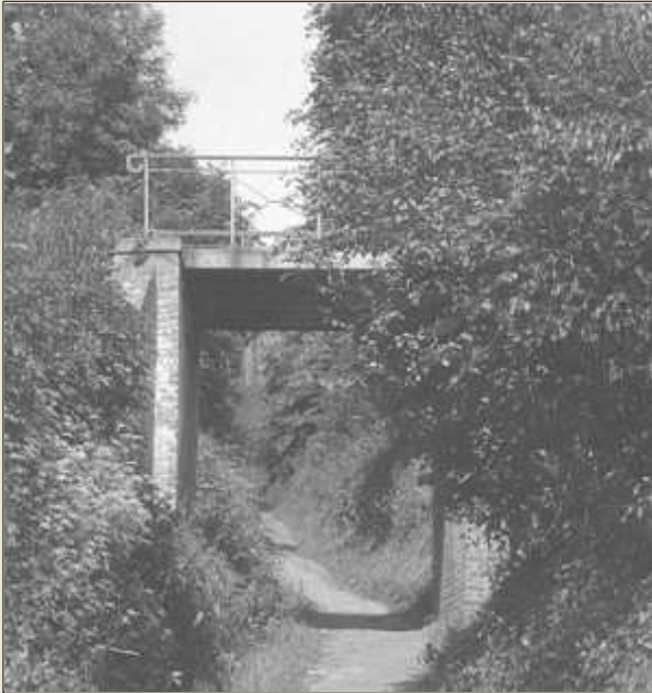
Le pont de la rue du Frise (v. 1930)

Situé juste à côté de l'ancienne laiterie Delrez, le pont au-dessus de la rue du Frise existe toujours même si ça fait belle lurette que plus rien ne passe dessus. La laiterie, elle, a disparu et ses anciens bâtiments ont connu depuis lors, bien des transformations.