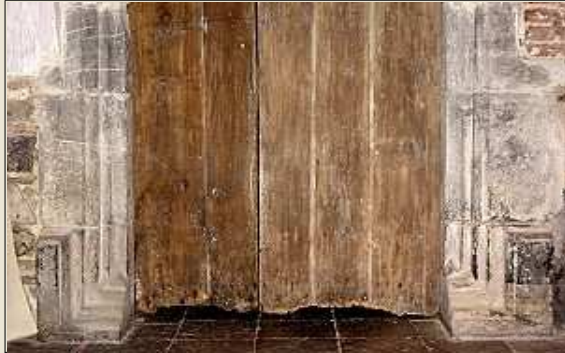
Encadrement de porte en pierre datant de la construction précédant le château actuel.