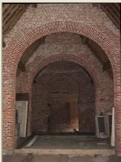
Les combles de l'aile nord

L'aile nord possède au niveau des combles, une rangée de murs de refend en briques percés de hautes baies couronnées d'arcs en plein cintre de toute beauté.