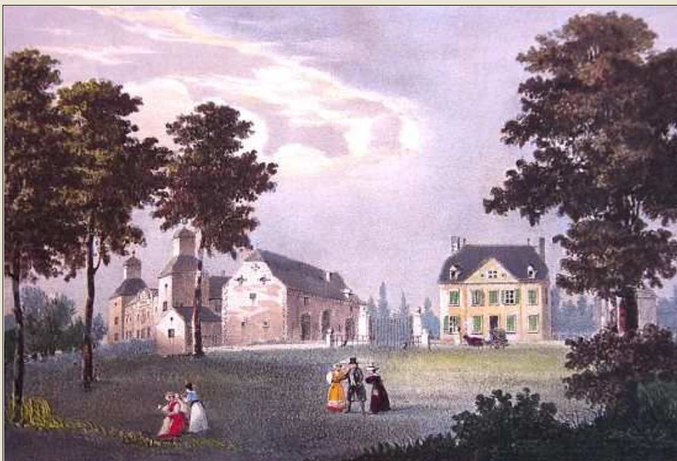
Vue des châteaux de Méan et de La Motte au XVIII e siècle (De Peelaert del)

Par la suite (milieu du XV e s.), elle sera au centre de querelles entre les seigneurs de Herstal et de Saive pour le versement de rentes. Bien que toujours renseignée comme terre de Brabant, elle dépendra jusqu'au XVII e s. de la Cour allodiale de Liège tout comme Saive. (Ed. Poncelet)