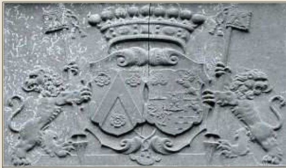
Le blason des familles Rosen et Rossius.