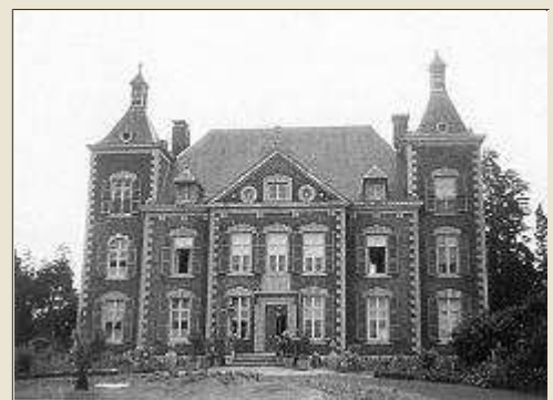
La façade principale (vers 1950)