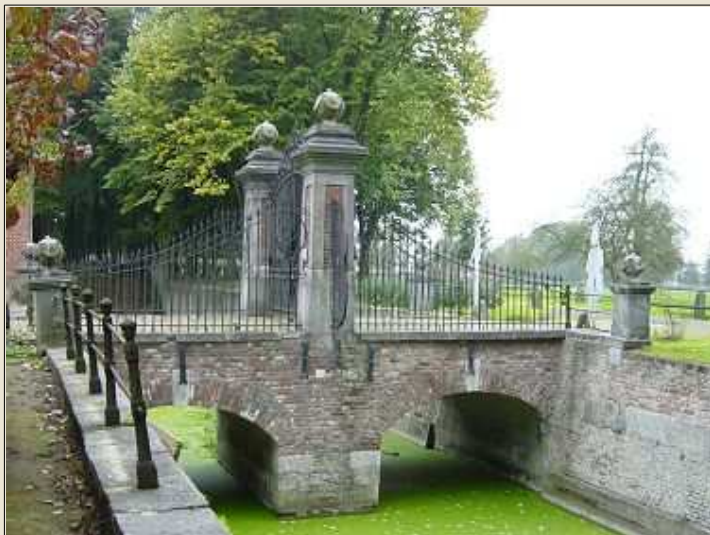
Le pont donnant accès au château

L'aile nord possède au niveau des combles, une rangée de murs de refend en briques percés de hautes baies couronnées d'arcs en plein cintre de toute beauté.