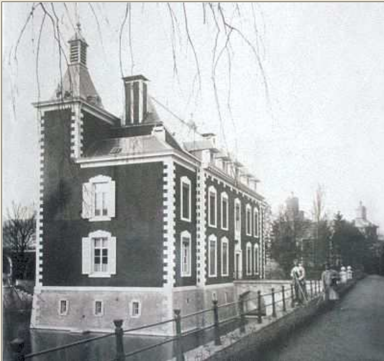
La façade arrière du château avec en fond les deux tours du château de Méan. (vers 1930)

C'est à cette date qu'Armand de Neuville, époux de Caroline Loërsch achète la propriété. Il était le fils du bourgmestre Pierre-Denis de Neuville de Petit-Rechain et fondateur du charbonnage de Marihay. On lui doit l'adjonction des quatre tours (au château et aux dépendances) et la réfection des douves à la fin du XIX e siècle.