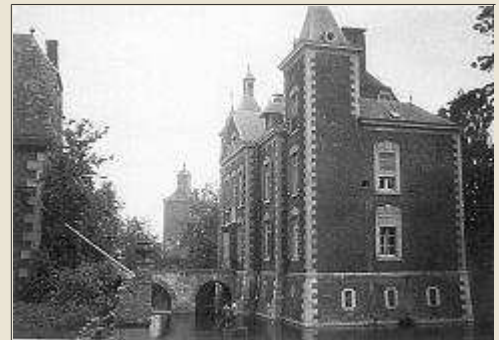
Les douves et l'angle du château